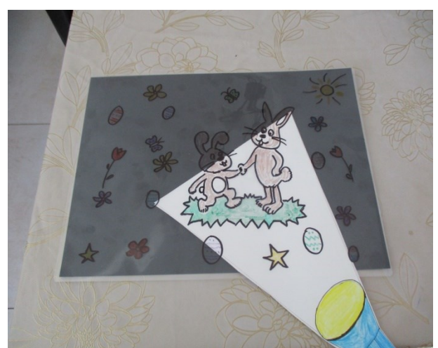
Die Taschenlampe zwischen Laminiertasche und das Schwarzes Blatt zum Beleuchten bewegen