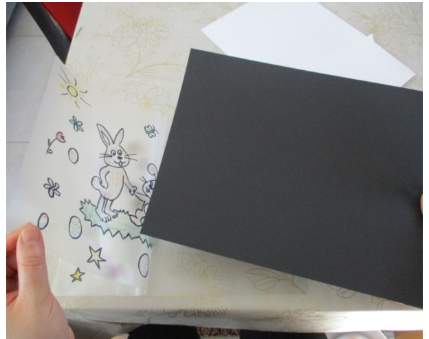
Ein schwarzes Blatt in die Laminiertasche legen