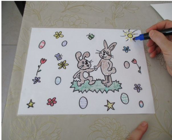
Auf eine Laminiertasche malen