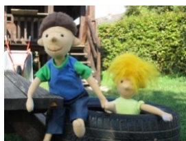
AWO-Familienzentrum + Kita „Marie Juchacz“

Kindertagesstätten Kindertagespflege Familienzentren