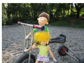
AWO-Kita „Helene Simon“