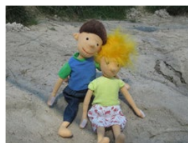
AWO-Familienzentrum + Kita „Marshallstraße“