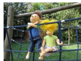
AWO-Familienzentrum + Kita „Kinder der Welt“