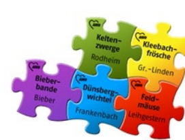
AWO-Kindertagespflege im Landkreis Gießen

Gemeinnützige Gesellschaft für Soziale Dienste der AWO Stadtkreis Gießen mbH Tannenweg 56, 35394 Gießen 0641 / 4019-0