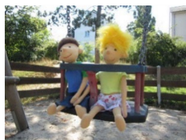
AWO-Familienzentrum + Kita „Lotte Lemke“