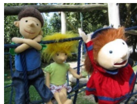
AWO-Familienzentrum + Kita „Rödgen“