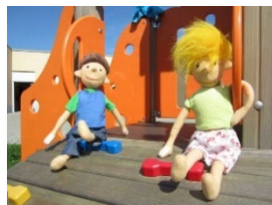
AWO-Krabbelgruppe „Sonnenkinder“ im Heinrich-Albertz-Haus