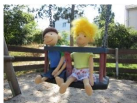
AWO-Familienzentrum + Kita „Lotte Lemke“