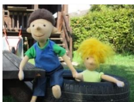
AWO-Familienzentrum + Kita „Marie Juchacz“

Kindertagesstätten Kindertagespflege Familienzentren