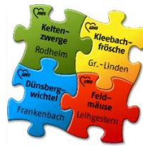
AWO-Kindertagespflege im Landkreis Gießen

Gemeinnützige Gesellschaft für Soziale Dienste der AWO Stadtkreis Gießen mbH Fachbereich Kinderbetreuung Grünberger Straße 222, 35394 Gießen 0641 / 966117-01