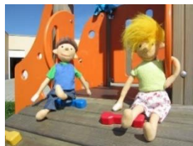
AWO-Krabbelgruppe „Sonnenkinder“ im Heinrich-Albertz-Haus