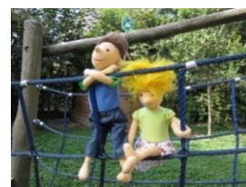
AWO-Familienzentrum + Kita „Kinder der Welt“