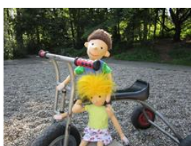
AWO-Familienzentrum + Kita „Helene Simon“