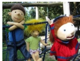
AWO-Familienzentrum + Kita „Rödgen“